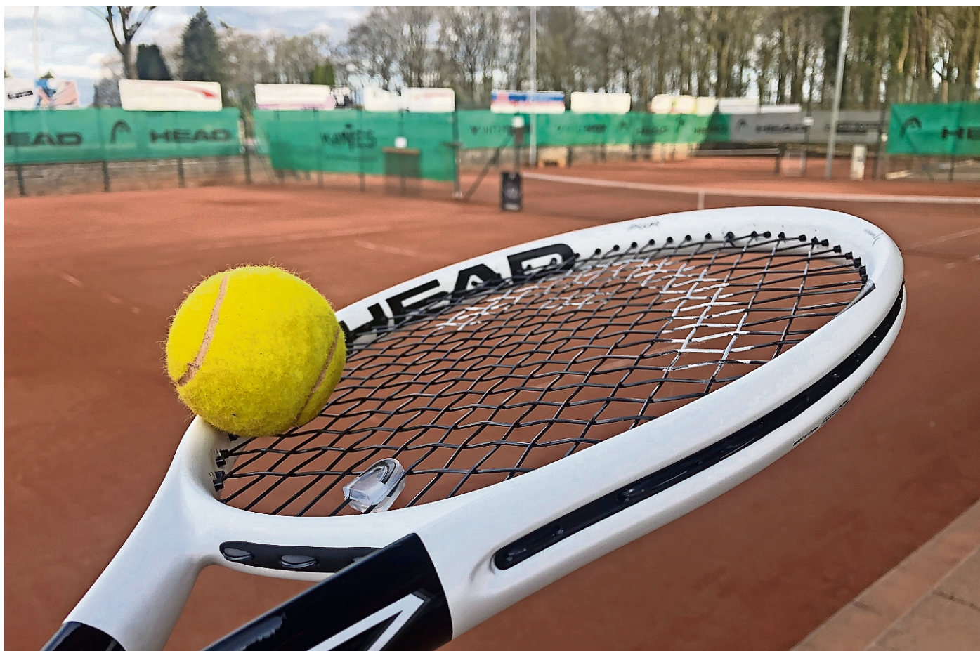
Blick über den Schlägerrand hinaus gerichtet: Der TV Bremervörde will sich nicht auf dem Erreichten ausruhen.