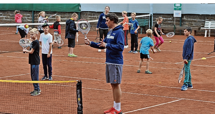
Am Freitag kommt der TNB mit einem Trainerteam zum Jugendtag.

vater Zusammenschluss betruer Bremervörder Bürger mit einem Tennisplatz auf privatem Grundstück war.